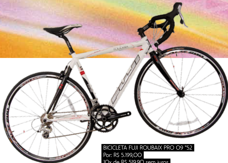
BICICLETA FUJI ROUBAIX PRO 09 "52 Por: R$ 5.199,00 10x de R$ 519,90 sem juros Descrição -090505 Gamaia Esportes