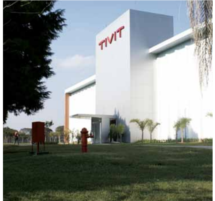
TIVIT em São José dos Campos

Notas: 1. TI (Tecnologia da Informação) pode ser, em geral, definido como um conjunto de todas as atividades e soluções providas por recursos de computação. 2. BPO (Business Process Outsourcing ou Processo de Terceirização de Negócios) é a terceirização de uma determinada área ou departamento de uma organização, que normalmente não faz parte do seu negócio principal.