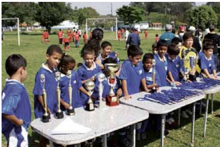
Torneio realizado pela escolinha de futebol da ADCCTA

No próximo dia 8 de maio, a ADCCTA (Associação Desportiva Classista dos Servidores Civis e Militares do Centro Técnico Aeroespacial) comemora 20 anos de fundação.