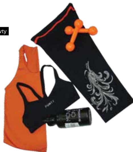
Garrafa Brasil Sul R$ 10,00 Oficina do Corpo