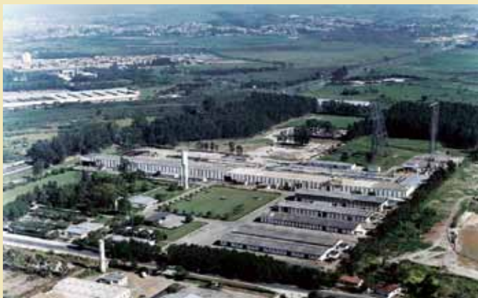
SadeFem em Jacareí