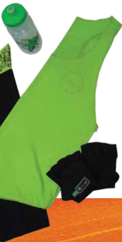
Calça corsário Powty R$ 49,90