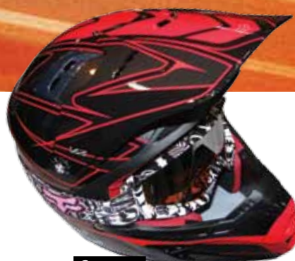
Capacete FOX V2 R$ 760,00

ONDE ENCONTRAR FX Fox (12) 3911-4166 Boutique Cia Athletica (12) 3941-3632 Ilha do Mel (12) 3942-5248 Oficina do Corpo (12) 3923-2165 Gamaia Esporte (12) 3935-3505