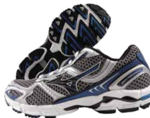
TÊNIS MIZUNO WAVE PRORUNNER 13 MASC Por: R$ 399,90 10x de R$ 39,99 sem juros Descrição- 112040 Gamaia Esportes