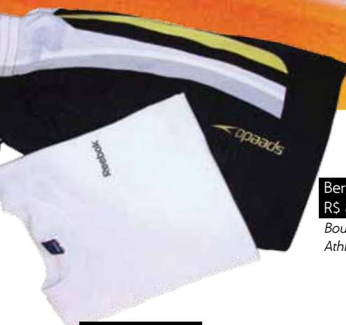
Bermuda Speedo R$ 84,00 Boutique Cia Athletica