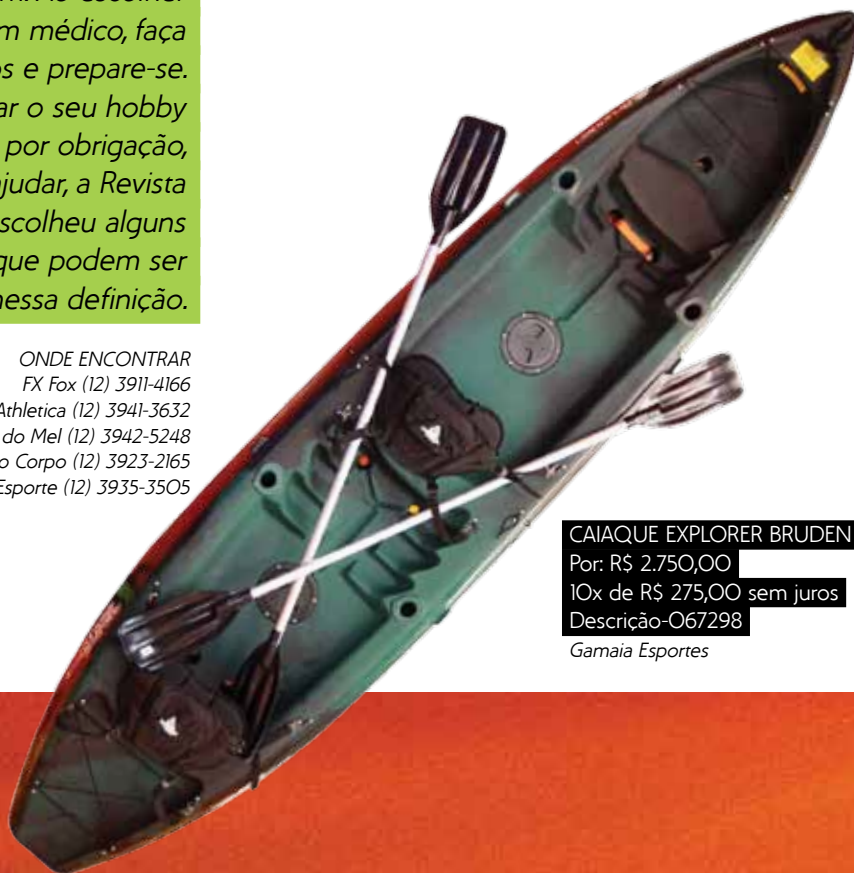
CAIAQUE EXPLORER BRUDEN Por: R$ 2.750,00 10x de R$ 275,00 sem juros Descrição-067298 Gamaia Esportes

* Preços sujeitos a alteração sem aviso prévio