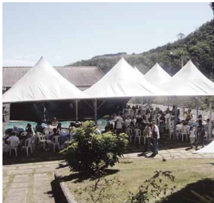
Feijoada da ADCCTA, um dos eventos promovidos pela associação

da coordenação das palestras com profissionais especializados de diversas áreas, psicólogos, médicos e dentistas, além de realizar um trabalho de prevenção, em parceria com os convênios médicos, com grupos sujeitos a problemas de saúde (hipertensão, diabetes, obesos, entre outros) em busca da melhoria da qualidade de vida.